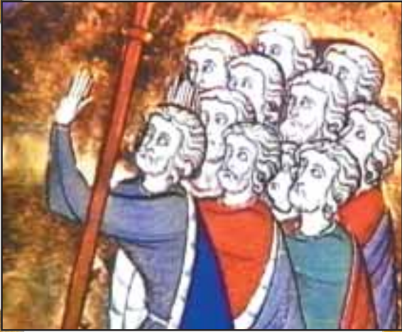
Yaptıklarından pişmanlık duyan Hz. Yusuf'un kardeşlerini tasvir eden bir Hıristiyan tablosu.

çek Kuran'da “Rabbin, dilediğini yaratır ve seçer; seçim onlara ait değildir...” (Kasas Suresi, 68) ayetiyle de bildirilmektedir.