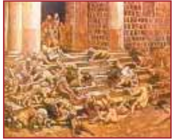
Zorlu geçen kıtlık yıllarını canlandıran tarihi tablolar.

Hatırlanacak olursa Hz. Yusuf Mısır'a köle olarak girmiş, ardından da "bir kadının ırzına göz dikmek" gibi son derece kötü ve çirkin bir iftiraya uğrayıp zindana atılmıştır. Fakat Allah, yüzeysel bir bakışla "imkansız" gibi gözükken bir değişiklik yapmış ve bu olumsuz şartlar içindeki Hz. Yusuf'u bir anda Mısır'ın yönetiminde söz sahibi bir insan haline getirmiştir. Gerçekte bu, yani yüzeysel bir bakışla imkansız gibi gözükken işleri gerçekleştirmek, Allah'ın bir ilmi ve sanatıdır. Kuran'da bildirildiği gibi, "Nice küçük topluluk, daha çok olan bir topluluğa Allah'ın izniyle galib gelmiştir." (Bakara Suresi, 249) Allah, müminlere bir iman hakikati olmak üzere, onları en zor ve imkansız gibi gözükken şartların içinde kurtarıp çıkarmakta ve inkarcılara karşı galip getirmektedir. Mümine düşen tek görev, Allah'ın vaadine olan inancından asla dönmek ve hep Allah'a tevekkül edip güvenmektir.